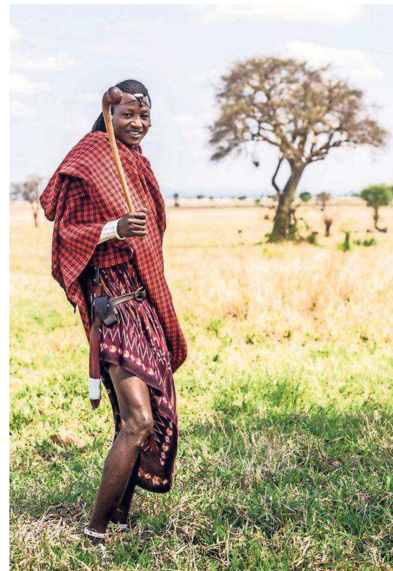
Een Masai-krijger in markante traditionele kledij leidt je over de savanne.

Aan elftallen doen we niet. Dit is een partijtje met pak-'m-beet honderd man waarbij de jongens lachend aan m'n armen en benen hangen. De meiden moedigen ons aan vanaf de zijlijn. „Hatsekidee!” roep